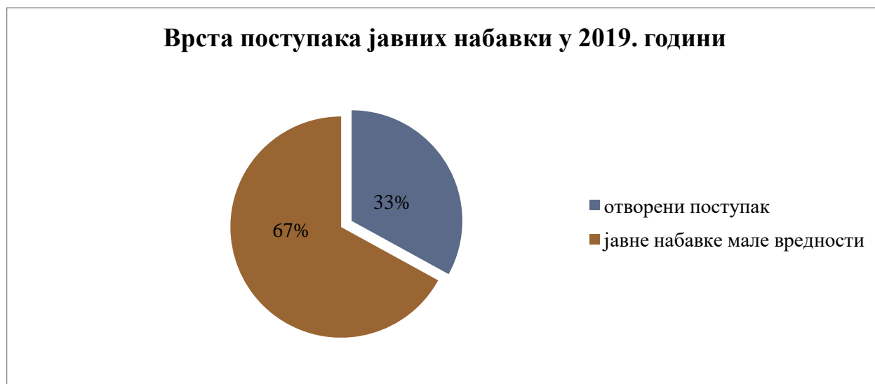
Графикон број 3 - Врсте поступака јавних набавки у 2019. години

Врсте и вредности спроведених и ревидираних поступака јавних набавки у 2019. години представљени су графиконима број 3 и 4: